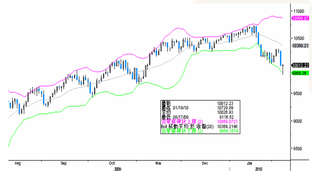
標準普爾 500 指數保歷加通道走勢圖