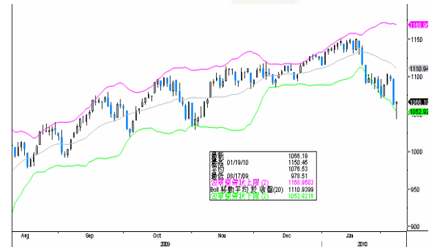
納斯達克指數保歷加通道走勢圖