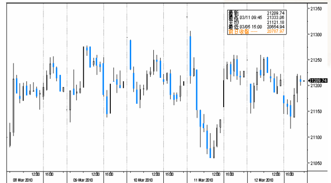
國企指數 5 天 15 分鐘走勢圖