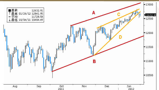
道瓊斯工業平均指數日線走勢圖