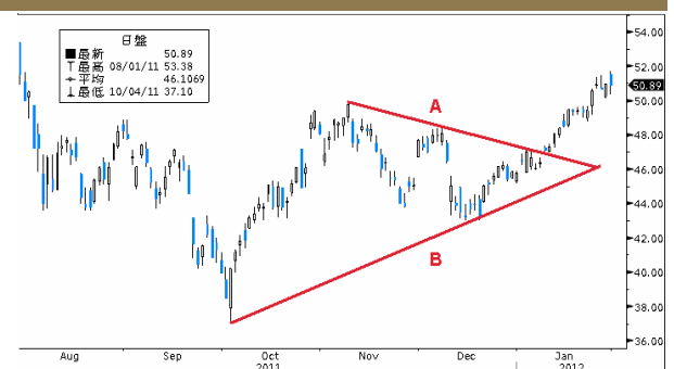
El DuPont de Nemours & Co.(DD) 日線走勢圖