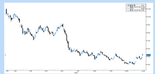
中國南方航空(1055.HK) 股價走勢圖