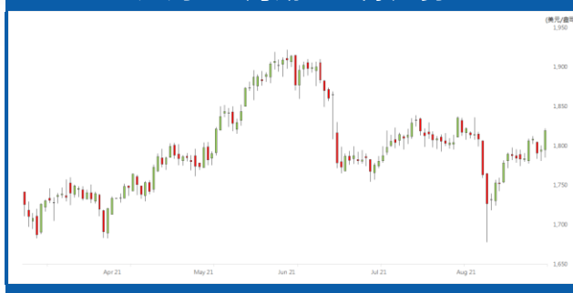
紐約 12 月期金日線走勢圖