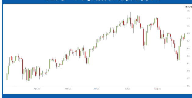
紐約 10 月期油日線走勢圖