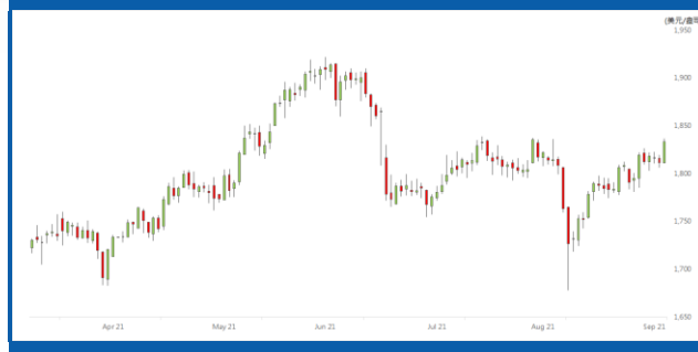
紐約 12 月期金日線走勢圖