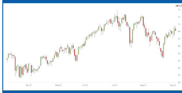
紐約 10 月期油日線走勢圖