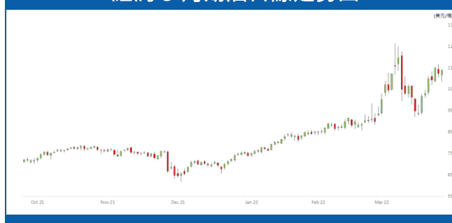
紐約 5 月期油日線走勢圖