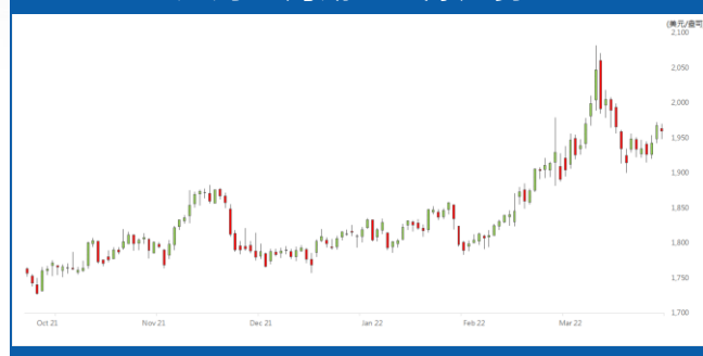
紐約 6 月期金日線走勢圖