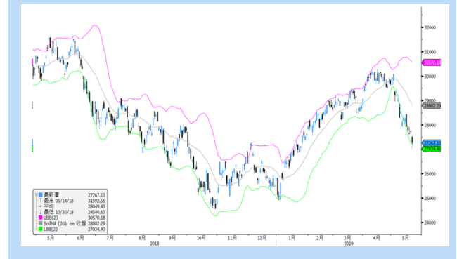
國企指數保歷加通道走勢圖