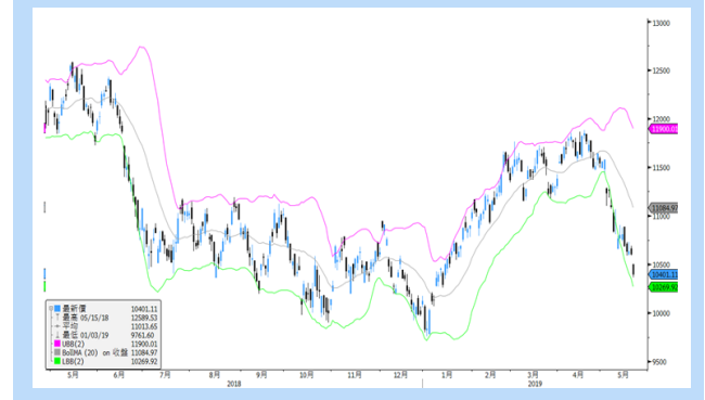
恒指 5 月期貨 5 分鐘走勢圖