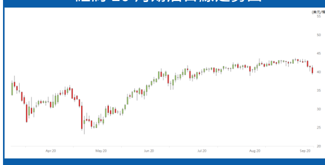
紐約 10 月期油日線走勢圖