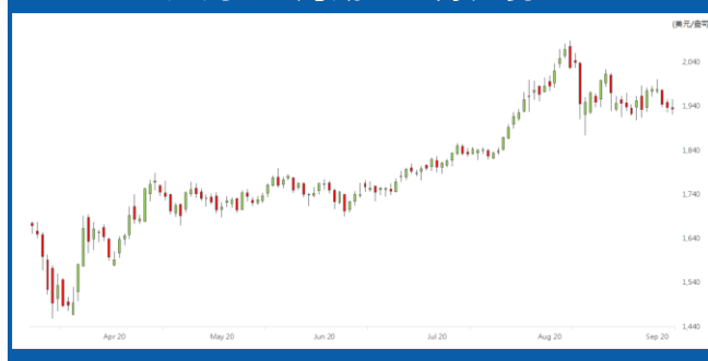
紐約 12 月期金日線走勢圖