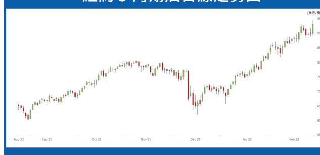
紐約 3 月期油日線走勢圖