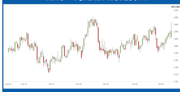
紐約 4 月期金日線走勢圖