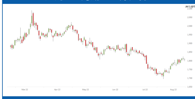
紐約 12 月期金日線走勢圖