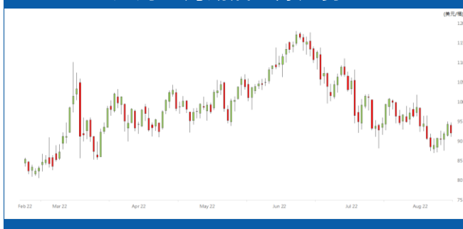
紐約 9 月期油日線走勢圖