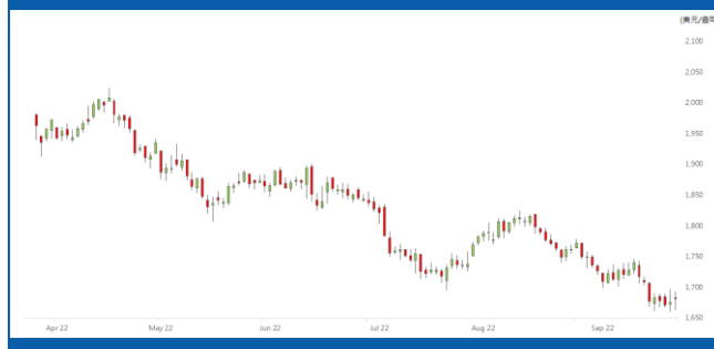
紐約 12 月期金日線走勢圖