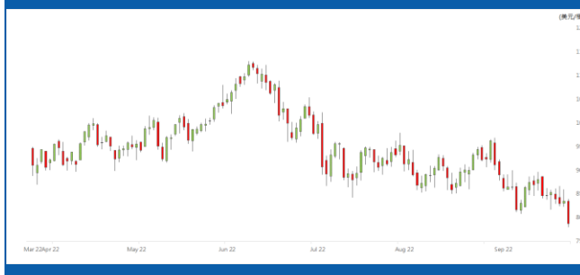
紐約 11 月期油日線走勢圖