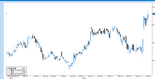
中國中鐵(390.HK) 股價走勢圖